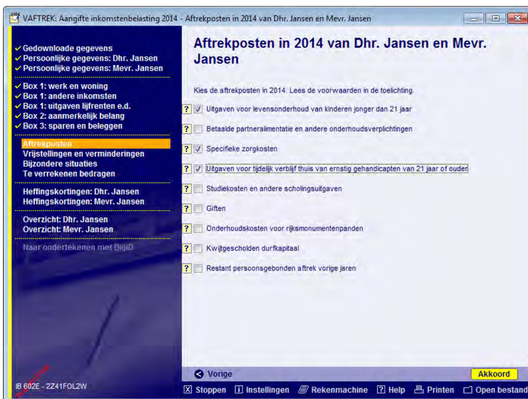
Afbeelding 1 - De persoonsgebonden aftrekposten 2014

Net als in voorgaande jaren, vindt u in de aangifte 2014 onder de knop 'Aftrekposten' drie aftrekposten die speciaal van belang zijn voor mensen met een ziekte of beperking.