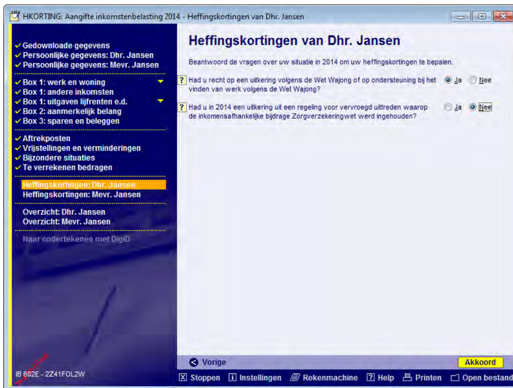
Afbeelding 3 - De jonggehandicaptenkorting